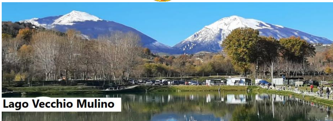
Lago Vecchio Mulino

Lago Vecchio Mulino Contrada Santo Stefano, 64012 Campli TE